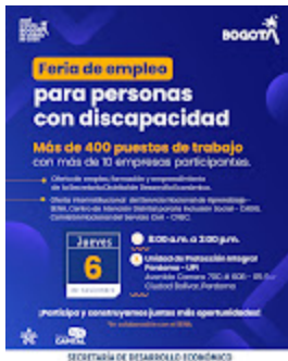
291025empleodiscapacidadCA (1).jpg 1639K